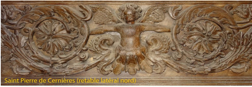
Saint Pierre de Cernières (retable latéral nord)