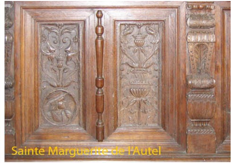
Sainte Marguerite de l'Autel