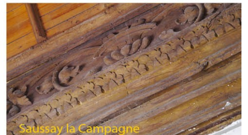
Saussay la Campagne