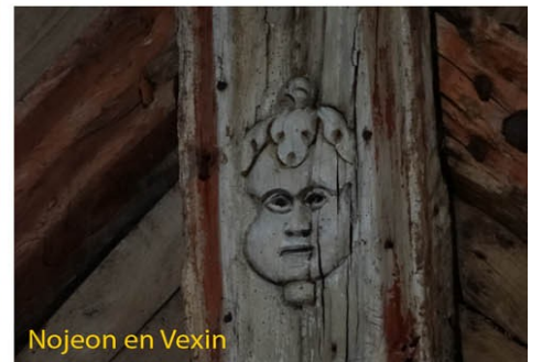
Nojeon en Vexin