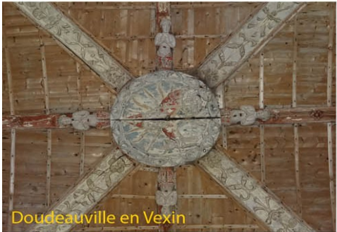
Doudeauville en Vexin