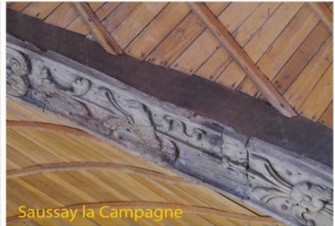
Saussay la Campagne